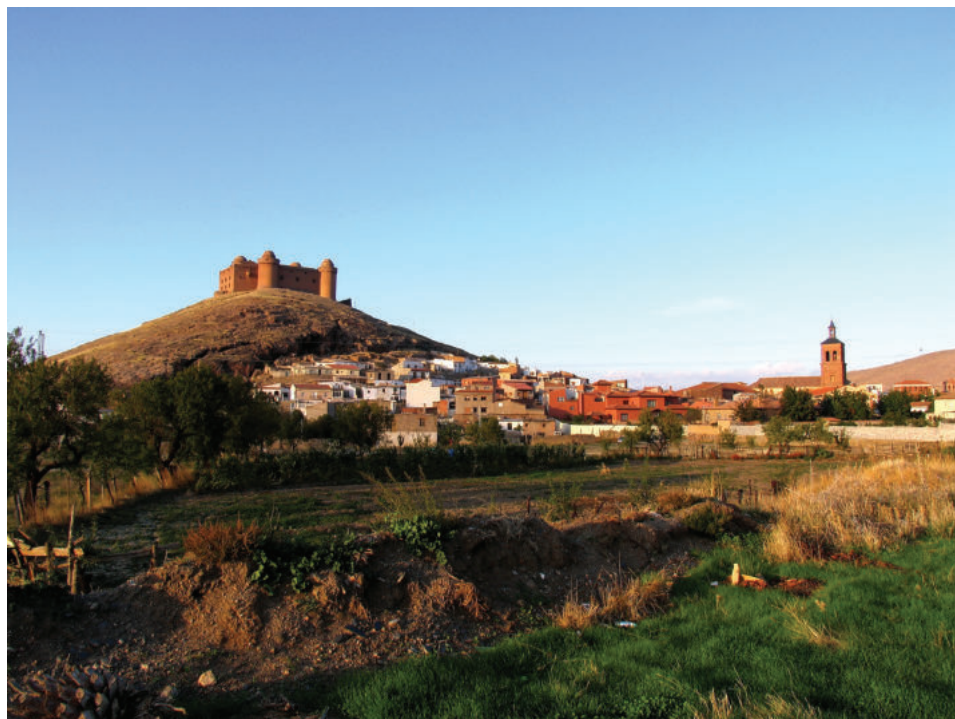
Lám. 13. El castillo con la villa de La Calahorra a sus pies, donde acampó el ejército del marqués de los Vélez.

Finalmente, fue el propio marqués quien tomó la iniciativa, tras la sublevación de Orce el 20 de noviembre y el intento de asalto rebelde de Huéscar. Estos acontecimientos convencieron al noble de la imperiosa necesidad de actuar en la zona. El día 21 amaneció con una tempestad de agua y nieve que impidió su salida de La Calahorra. Amanada la tormenta, partió definitivamente el día 23 con mil infantes y doscientos caballos. Posteriormente, el capitán general lo relevó de su cargo, si bien le ofreció un puesto en el Estado Mayor, pero Fajardo rehusó y se retiró a su castillo de Vélez Blanco, centro de su señorío (Sánchez, 2002: 181-186), sin intervenir en la toma de Galera, que claudicó el 7 de febrero de 1570.