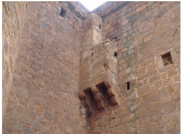
Lám. 6. Ladronera del castillo de La Calahorra.