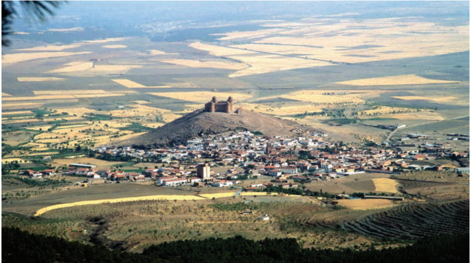
Lám. 10. Panorámica de los llanos del Marquesado que circundan al castillo de La Calahorra, desde las primeras pendientes de la sierra.

alimentar. Finalmente, el proceso se remató prendiendo fuego a los pueblos ante la impotente mirada de sus moradores, que los veían consumirse desde la sierra. Allí permanecieron largos y tormentosos días, hasta que muchos de ellos terminaron por saltar a los pueblos no sometidos de la Alpujarra.