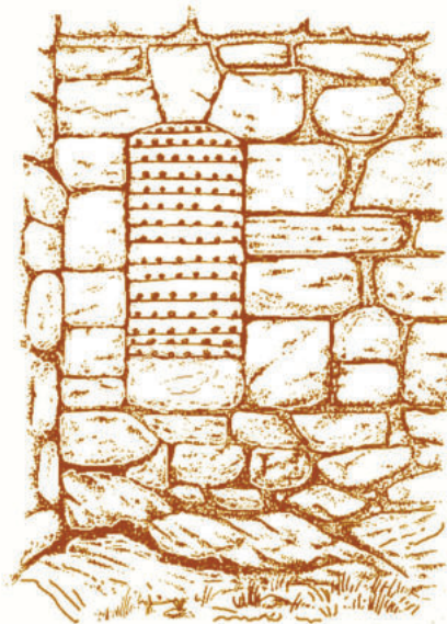
Lám. 8. Recreación de la puerta blindada con lamas de hierro oculta en la poterna.