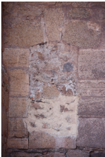
Lám. 7. Poterna tapiada del castillo de La Calahorra.