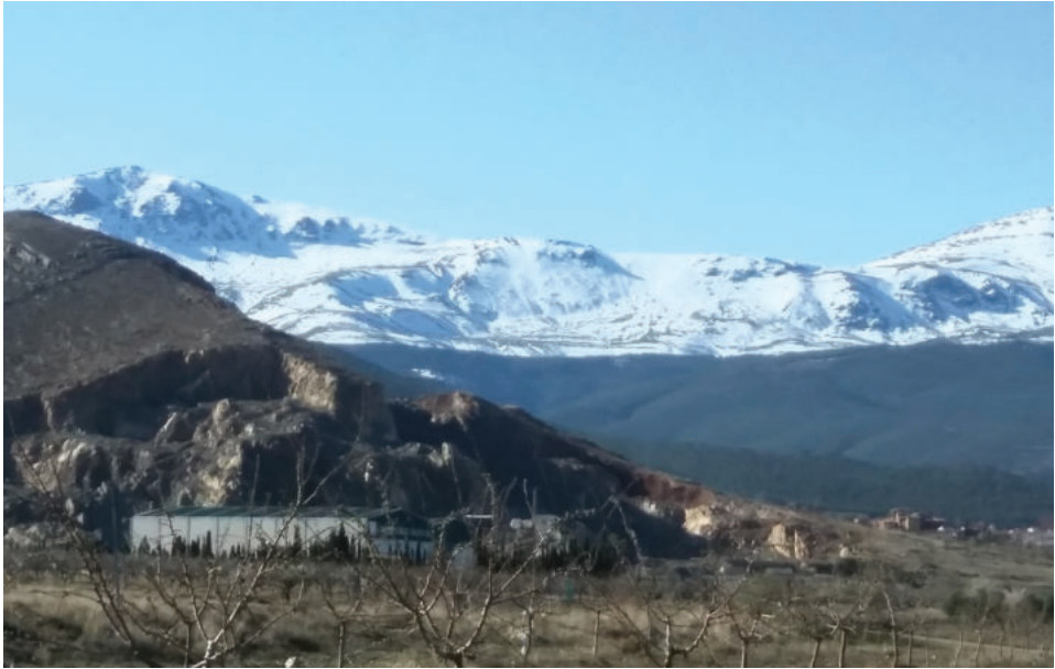
Lám. 12. Las llanadas de Lot en las cumbres de Sierra Nevada. A la derecha, parte del caserío de La Calahorra.

dinación, determinó un estado de indisciplina en la tropa cada vez más acusado. Hambre y enfermedades eran campo abonado para las deserciones en masa, a veces encubiertas con dolencias fingidas como artimaña para huir del campo con el botín que pudiesen transportar. Los soldados robaban en las panaderías de la ciudad y su hospital estaba tan desbordado que no podía ni registrar los enfermos que llegaban.