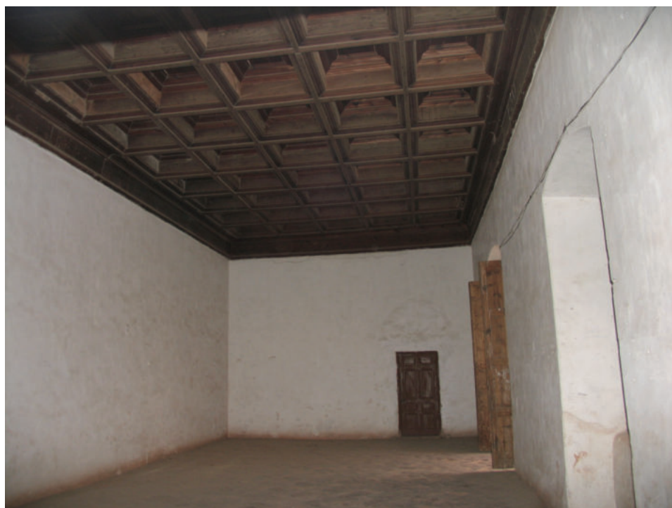
Lám. 14. Uno de los grandes salones del castillo, donde debieron instalarse las numerosas presidiarias que en él se custodiaron.

Igual demuestra la expedición que envió el citado militar el 16 de abril desde Ugijar, vía La Ragua, a La Calahorra en busca de víveres, al tiempo que llevaba seiscientas cautivas moriscas, para confinarlas tras sus muros, y muchos enfermos al hospital de Guadix. Iba al frente el marqués de Favara y a pesar de valorar que el camino era peligroso se decidió ir por él, tanto por la proximidad como por la imposibilidad de transportar enfermos por el puerto de Lot. Fue uno de los mayores desastres sufridos por el bando cristiano en esta guerra. La escolta de mil infantes no pudo evitar el ataque morisco, con un saldo de ochocientos muertos y la liberación de las cautivas. Finalmente Favara pudo llegar al castillo con los restos del naufragio (Mármol, 2015: 648). El revés conmocionó a Sesa y lo embargó de dudas y temores. De hecho renunció a llevar, por miedo a otra contundente emboscada, su campo desde Ugijar a La Calahorra como meses antes hiciera el marqués de los Vélez. Por ello desde allí se trasladó a Adra.