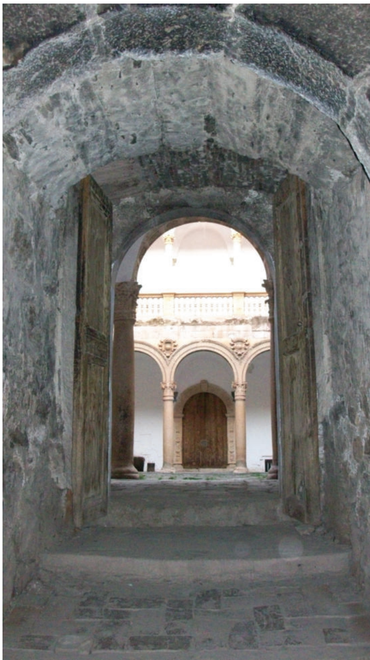
Lám. 2. Entrada al calabozo de La Calahorra donde debieron estar reclusos los sesenta monjes. Foto: R. Ruiz Pérez.