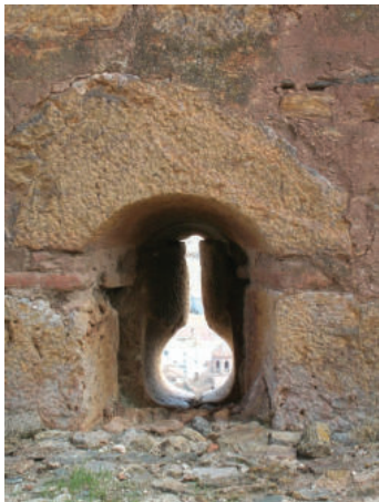
Lám. 5. Aspillera del castillo de La Calahorra.