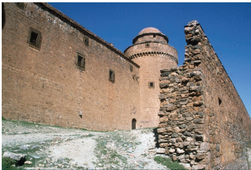
Lám. 9. Revellín levantado frente a la fachada principal del castillo y espacio entre ambos (albacar), donde los asaltantes consiguieron llegar.