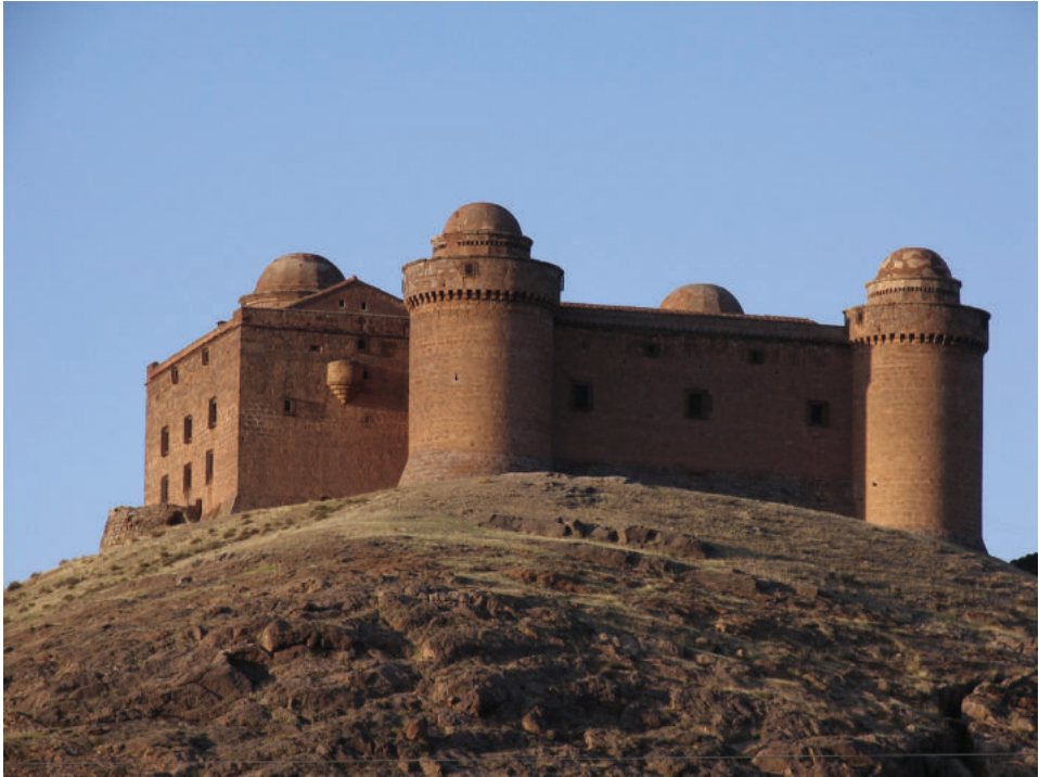
Lám. 1. El castillo-palacio de La Calahorra visto desde el sur.