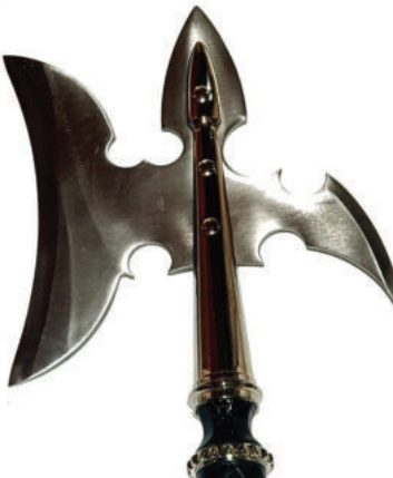
Lám. 15. Alabarda.

En fin, pobreza, trabajo y penurias no fue todo lo que tuvieron que afrontar aquellos pioneros, sino que arriesgaron también sus vidas a manos de los monfíes. Reducidos años más tarde, la cuestión morisca sólo quedó para la memoria de las generaciones venideras. En cuanto al castillo, aunque por muchos años siguió bien armado, los tambores de guerra no volvieron a repicar en sus almenas. En adelante sus funciones serían más prosaicas, siempre vinculadas al gobierno y réditos del territorio que controlaba.