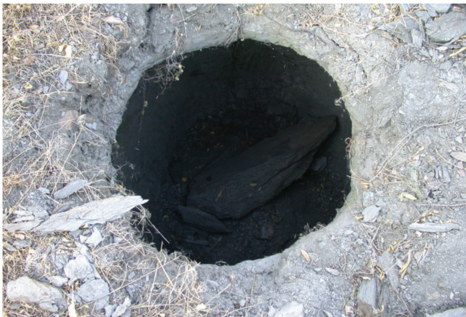
Lám. 11. Silo localizado en Dólar.

mientras que el resto de la servidumbre pudo escapar. Acusado de complicidad con el grupo que atacó, Marzón fue encarcelado en el castillo. Se defendió diciendo que durante la refriega todos oyeron gritos de los rebeldes diciendo “está también el perro de Marzón”, lo que claramente invalidaba la acusación. Esto demuestra una vez más la difícil situación de los colaboracionistas, pues para los suyos eran traidores, mientras que para los cristianos se trataba de unos moros más en los que no se podía confiar. Entre estos había cuajado el dicho: “Todos son uno” (Ruiz, 1991: 308; Garrido, 2014: 51, 74).