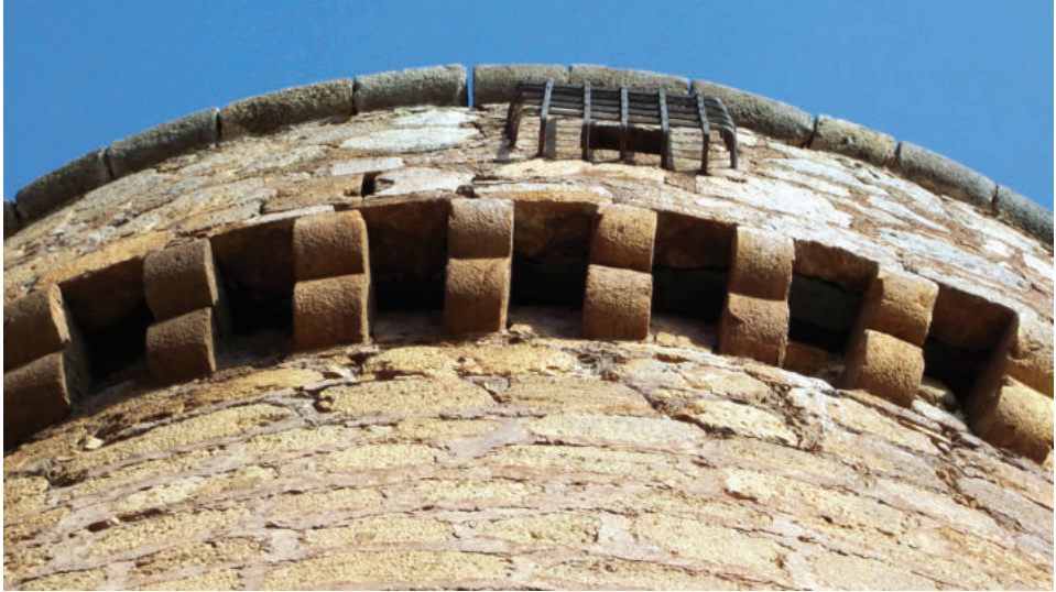
Lám. 4. Matacán del castillo de La Calahorra.

varones mayores de las familias recogidas- era apto para tomar las armas, dirigidas por algunos oficiales como el capitán Hernández, enviado por Mondéjar. No debieron ser muchos más, pues recordemos que Mármol (2015: 294) refiere que los vecinos pidieron al gobernador doscientos soldados, pagados a su costa, para defenderse de los montaraces de la Alpujarra, cifra que alegó no tener.