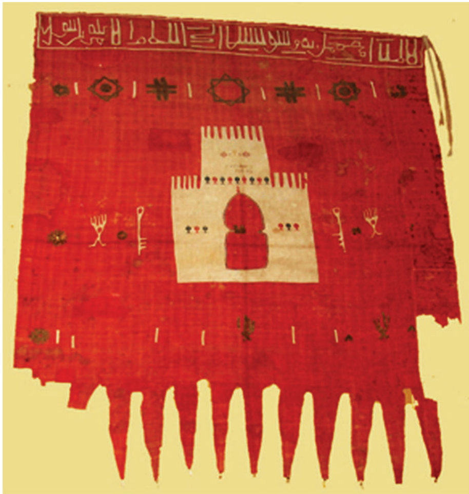
Lám 3. Bandera de Cantoria, pendón supuestamente arrebatado a los moriscos en Arboleas (Almería), con motivos islámicos: mano de Fátima, llave y estrella. Ayuntamiento de Lorca.

Efectivamente, de inmediato se levantó Aldeire, enclave estratégico que arrasó a las villas del sector occidental, Alquife, Lanteira y Jérez. La rebelión tuvo su colofón con la ocupación de La Calahorra el día de la Epifanía, y la consiguiente suelta de los monfíes. Desde las almenas del castillo, sus moradores describieron el alzamiento de la villa como “un gran tropel de gente que bajaba entre grandes voces, con atabales, trompetas y 26 banderas altas y tendidas” (Mármol, 2015: 315). Un golpe de ellos entró en la iglesia parroquial de la villa y le prendió fuego. Si quisiéramos aproximarnos a las familias moriscas levantadas en toda la comarca, debieron rondar la cifra de 2200; o sea, entre 9000 y 11 000 almas, que podían muy bien tener 3500 ó 4000 hombres de pelea, a los que habría que sumar otros 2000 que bajaron de la Alpujarra a empujar la rebelión.