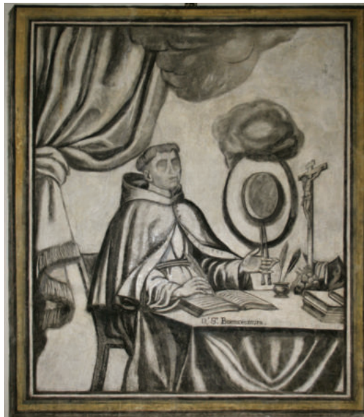
Lám. 7. Escena con San Buenaventura, después del trabajo realizado.

Representación de san Buenaventura (Bagnoregio, 1217 - Lyon, 1274), situado a la derecha, junto a La estigmatización de San Francisco . Doctor de la Iglesia, místico, cardenal, que llegó a ser general de la Orden franciscana y obispo de Albano. Se formó en la Orden de los Frailes Menores e impartió enseñanzas en la Universidad de París, en la cual estudió, siendo discípulo de Alejandro de Hales. Fue nombrado “doctor seráfico” (que tiene las características que se consideran propias de los serafines, como la contemplación). San Buenaventura, inspirándose en san Agustín, se opone al aristotelismo de los dominicos y sostiene que la filosofía y la razón no se encuentran en la base de la teología ni en el conocimiento de la divinidad, pero sí en el camino que conduce el alma hacia Dios. Atributos propios son el capelo cardenalicio y el crucifijo.