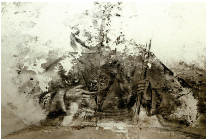
Lám. 36. Antigua fotografía de archivo en la que vemos a un fraile con medallón dominico. Esta pintura se encontraba en la bóveda de la galería oeste del claustro bajo, pero las catas tomadas confirmaron la imposibilidad de su recuperación.

Sin embargo, ciertas muestras tomadas en la galería sur del claustro bajo, en este caso, en la pared a la derecha del ventanal de la actual oficina de turismo sí revelaron que otras cartelas con orlas vegetales quedaron ocultas bajo el yeso laminado empleado en la rehabilitación del edificio. La restauración de estos restos será acometida en otra fase.