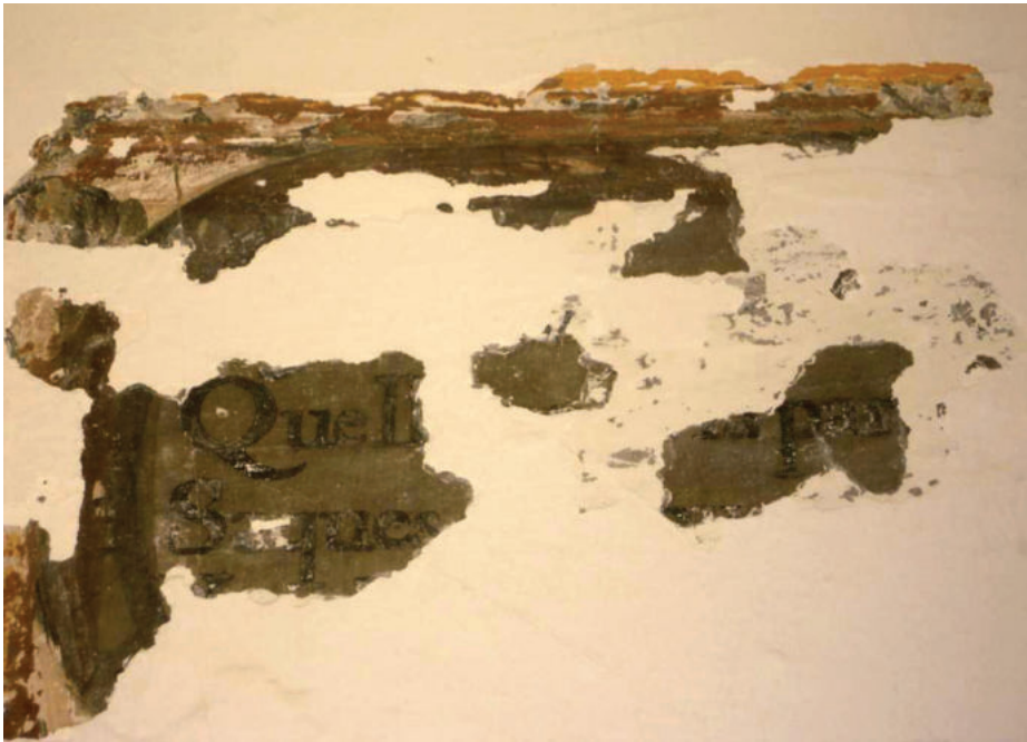
Lám. 45. Fragmento de cartela conservada en el antiguo convento de San José (Guadix).

En el monasterio antequerano también comprobamos que en la ornamentación de su claustro se ha prescindido del color optando por una técnica dibujística en grisalla, austera, pero muy rica en cuanto a la composición y la simbología. Con este recurso se busca una mayor claridad dentro de la máxima austeridad y se elige el negro como símbolo asociado a la muerte, a la desesperación y al dolor, siendo en estos espacios donde la idea de mortificación y penitencia para alcanzar la salvación se hace evidente en sus líneas iconográficas. Además, vuelven a repetirse las mismas octavas reales, como podemos comprobar.