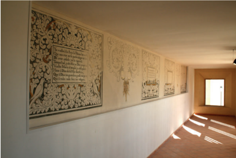
Lám. 22. Galería oeste del claustro alto, ya restaurada.

octavas reales, que son estrofas de ocho versos endecasílabos, con rima consonante; quintillas, de cinco versos; cuartetos, de cuatro, y tercetos. Las octavas del claustro bajo son obra del místico francés Johannes Tauler (1300-1361), pero en este caso extraídas del libro Escala mística y estímulo de amor divino , una recopilación de fray Antonio Panes (1621-1676), místico y cronista franciscano que además de este compendio poético, fue quien redactó la crónica de la fundación de nuestro convento (Panés, 1743).