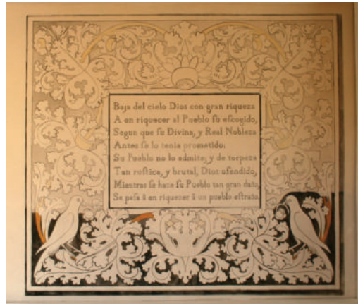
Lám. 35. Cartela ya restaurada.

“Baja del cielo Dios con gran riqueza A enriquecer al pueblo su escogido, Según que su Divina y Real Nobleza, Antes se lo tenía prometido: Su pueblo no lo admite y de torpeza Tan rústica y brutal, Dios ofendido, Mientras se hace su pueblo tan gran daño, Se pasa a enriquecer a un pueblo extraño.”