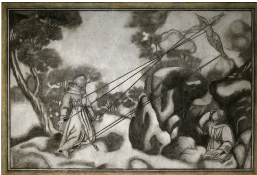
Lám. 4. La estigmatización de San Francisco, después de la intervención.