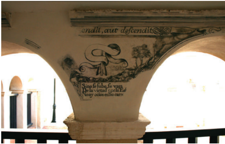
Lám. 31. Terceto de autor desconocido.

Esta simpar iconografía, nos muestra la alegoría de los cuatro vientos que aquí intervienen como aduladores, soplando con fuerza e intentando penetrar en los oídos, protegidos por una corona de espinas.