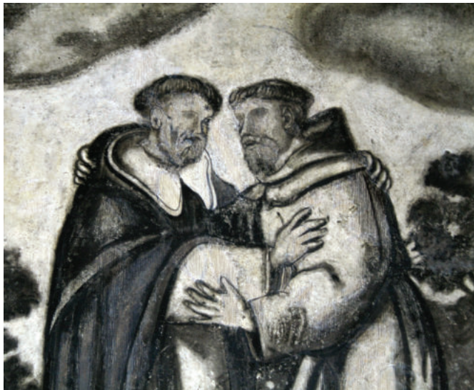
Lám. 13. Detalle de la estrella en la frente de Santo Domingo.

Una antigua leyenda narra que durante el bautismo de Domingo apareció una estrella sobre su frente. Por medio de su vida y predicación, Domingo fue como un faro guiando almas hacia Cristo. Dicho atributo también fue representado en esta escena.