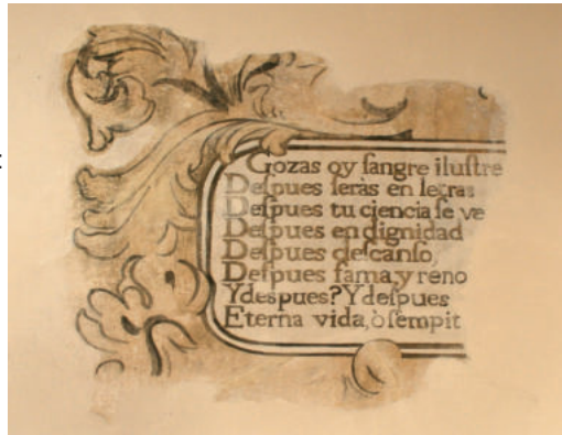
Láms. 29 y 30. Octavas reales de los sermones de Juan Taulero. Cartela ya restaurada.

“Gozas hoy sangre ilustre, edad florida; Después serás en letras instruido: Después tu conciencia se verá aplaudida: Después en dignidad constituido: Después descanso y deleitosa vida: Después fama y renombre esclarecido. ¿Y después? ¿Y después? ¡O trance fuerte! Eterna vida, o sempiterna muerte.”