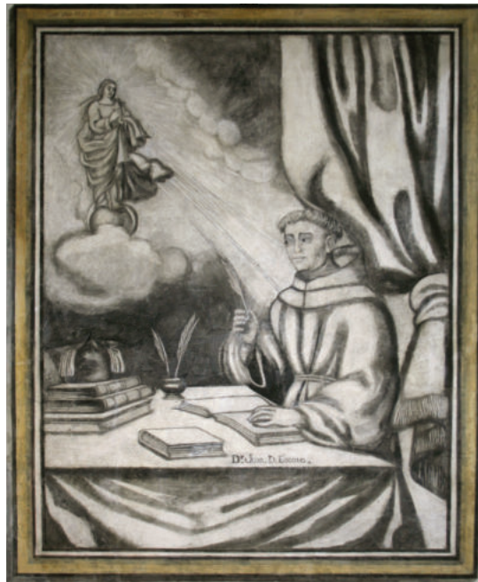
Lám. 8. Beato Juan Duns Escoto, ya restaurado.

Lo encontramos a la izquierda de la entrada y junto a san Pedro de Alcántara. Nacido en Duns (Escocia) en 1266 y fallecido en Colonia en 1308, fue un teólogo escocés perteneciente a la escolástica. Estudió en Cambridge, Oxford y París, siendo profesor en estas dos últimas universidades. La sutileza de sus análisis le valió el sobrenombre de “doctor sutil” (Autores varios, 1911). Se le veneró como santo sin mediar canonización y no sería hasta 1993 cuando el papa Juan Pablo II confirmaría su culto como beato. Como teólogo, defendió la humanidad de Cristo y preparó la base teológica para la proclamación del dogma de la Inmaculada Concepción. Es considerado el mayor racionalista de la Edad Media y fue autor de la llamada filosofía escolástica. Atributos propios son la imagen o visión de la Virgen María. Aquí se nos muestra recibiendo la inspiración divina sobre un libro aún por escribir.