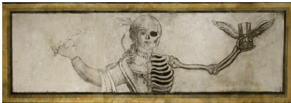
Lám. 14. Alegoría de la vanidad.

virtud. En nuestra pintura observamos a una dama con rica vestimenta y abalorios, en la otra mitad, la muerte levanta un reloj de arena alado, mostrándonos que el tiempo vuela, tempus fugit . Esta imagen entronca clarísimamente con los ideales de austeridad y pobreza franciscanos.