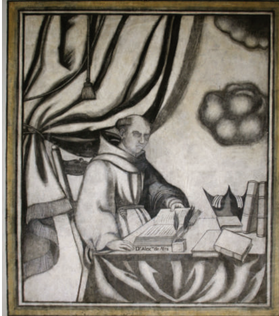
Lám. 9. Alejandro de Hales.

la Summa Theologiae , cuya primera parte está dedicada a las doctrinas de Dios y sus atributos; la segunda, a la creación y el pecado; la tercera, a la salvación y la expiación; y en la cuarta y última, a los sacramentos. Su teología es agustiniana, recurriendo, en alguna ocasión, a la filosofía de Aristóteles. Junto a su discípulo, san Buenaventura, se le considera el creador de la escuela franciscana de París.