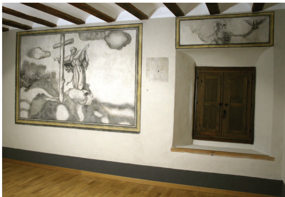
Lám. 3. Vista del lateral izquierdo de la Sala de Teólogos del ex convento franciscano de Huéscar, tras su restauración.

Lo que hace que este habitáculo sea destacable dentro del edificio es su decoración de pintura mural en grisalla. Esta se encuentra estructurada en escenas enmarcadas con filete o listel de tonos ocre. Desde el punto de vista técnico habría que reseñar que están ejecutadas con la técnica del falso fresco o pintura en seco aplicada con pigmentos de naturaleza mineral, aglutinados con colas de origen orgánico, sobre mortero de yeso.