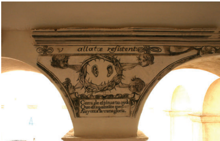
Lám. 32. Terceto de autor desconocido. Foto: el autor.

“Cerca de espinas tu oído Que esta punzante memoria Ahuyenta la vanagloria.”