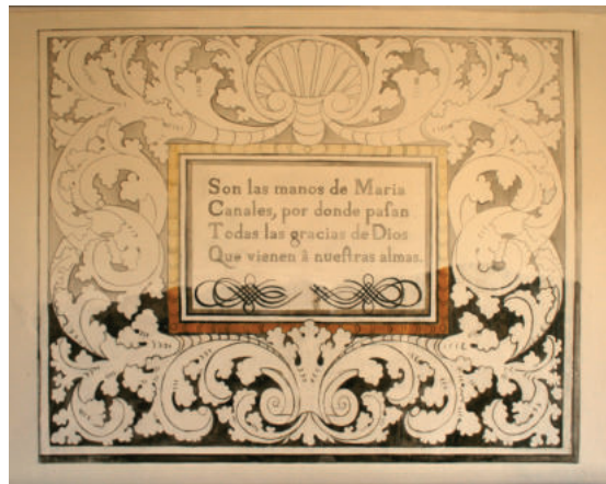
Láms. 33 y 34. Cartelas ya restauradas y reconstrucción de los fragmentos perdidos a partir de la documentación gráfica conservada en el Archivo Histórico Municipal de Huéscar.

“Son las manos de María Canales por los que pasan Todas las gracias de Dios Que vienen a nuestras almas.”