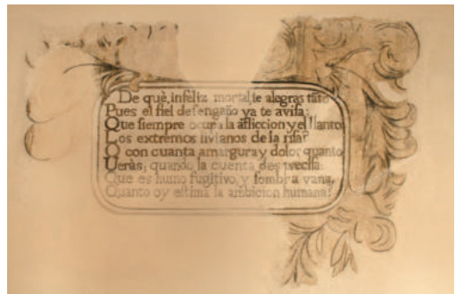
Láms. 27 y 28. Octavas reales de los sermones de Juan Taulero.

“¿De qué, infeliz mortal, te alegras tanto; Pues el fiel desengaño ya te avisa: Que siempre ocupa la aflicción y el llanto Los extremos livianos de la risa? ¿O con cuánta amargura y dolor cuánto Verás, cuando la cuenta des precisa: Que es humo fugitivo y sombra vana, Cuánto hoy estima la ambición humana?”