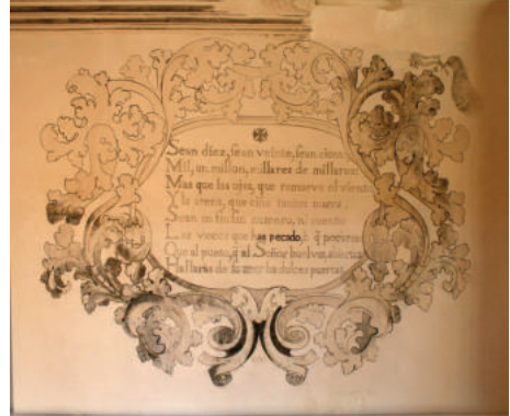
Lám. 26. Octava real de los sermones de Juan Taulero, que versa sobre la confianza en Dios. Cartela ya restaurada.

“Sean diez, sean veinte, sean ciento; Mil, un millón, millares de millares: Más que las hojas que remueve el viento Y la arena que ciñe tantos mares. Sean, en fin, sin número, ni cuento Las veces que has pecado o que pecares: Que al punto que al Señor vuelvas abiertas; hallarás de su amor las dulces puertas.”