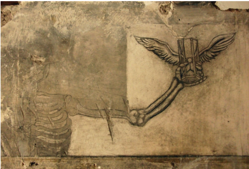
Láms. 15 y 16. Proceso de limpieza.