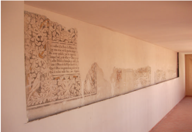
Lám. 41. Estucado.

A continuación, se procedió a reintegrar volumétricamente todas las lagunas, grietas y faltas de soporte, aplicando yeso como material de naturaleza afín a la obra.