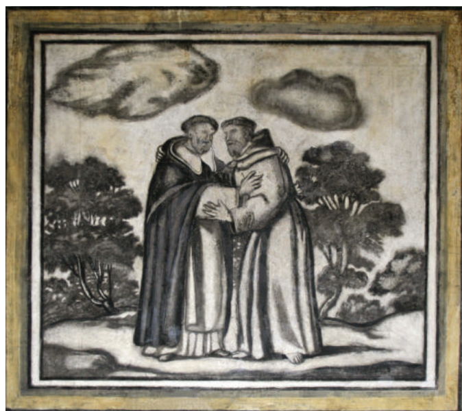
Lám. 12. El abrazo entre San Francisco y Santo Domingo.

La encontramos sobre el dintel de la puerta del fondo, flanqueada por Alejandro de Hales y Guillermo de Ockham. Los franciscanos y los dominicos, son dos Órdenes religiosos que se destacaron en tiempos anteriores a la Reforma luterana. Ambas pertenecen a la familia de “los