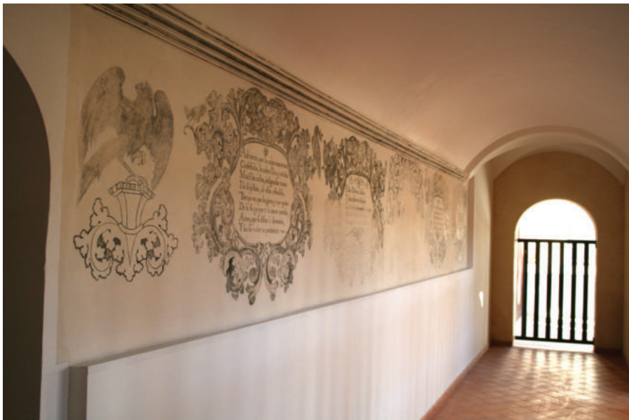
Lám. 21. Galería oeste del claustro bajo ya restaurada.

Pintura mural en grisalla con detalles ocre, sanguina y sepia en zonas puntuales del claustro alto. Está ejecutada con la técnica del falso fresco o pintura en seco con pigmentos minerales, utilizando como aglutinante cola de origen animal.