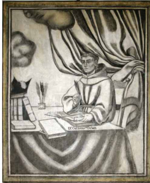
Lám. 10. Guillermo de Ockham, tras la restauración.

libros emerge, de entre sus páginas, a modo de separador una especie de escuadra, instrumento que se interpreta como una representación de la rectitud, de la honradez y el respeto por las leyes y reglas.