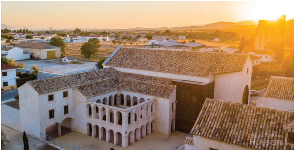
Lám. 2. Panorámica del convento de San Francisco de Huéscar.

El inmueble de Huéscar se encuentra situado en la actual calle de San Francisco y de él se conservaron la capilla mayor, parte del claustro que fue completado en la reconstrucción llevada a cabo durante los primeros trabajos de rehabilitación contemporánea, y algunas de las estancias domésticas, entre ellas, los posibles habitáculos utilizados para estudio, cocinas, refectorio, celdas, etc.