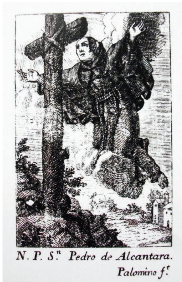
Lám. 6. Grabado extraído del libro de cabildos de elecciones de la provincia descalza de San Pedro de Alcántara, obra de Juan Fernando Palomino (siglo XVIII).

ininteligibles, entraba en éxtasis y quedaba suspendido en el aire. Un día ensayaba un joven en la huerta del convento el principio del Evangelio de San Juan y las palabras “el Verbo se hizo carne” le impresionaron tanto que empezó a volar levantado un codo sobre el suelo y atravesó cuatro puertas, llegó al altar mayor y quedó en éxtasis. Otra vez, no pudiendo soportar los ardores que le abrasaban salió a la huerta y quedó suspendido en el aire delante de una cruz, siendo este último el preciso instante que fue plasmado en la pintura que nos atañe, basada, sin género de dudas, en un grabado dieciochesco incluido en el libro de cabildos de elecciones de la demarcación alcantarina, obra de Juan Fernando Palomino. Como patrón de la provincia de religiosos menores descalzos que toma su nombre y dentro de la cual quedó el convento de Huéscar, su efigie mereció un lugar y tratamiento de relevancia dentro de la habitación.