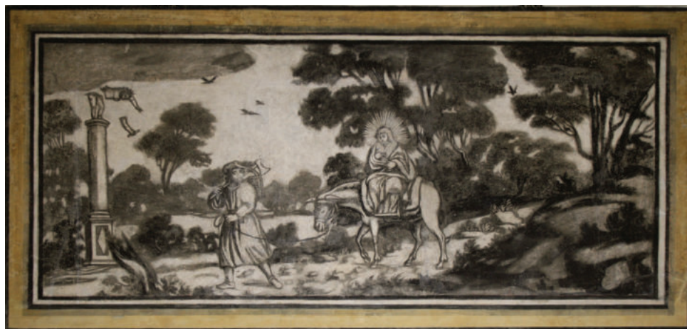
Lám. 11. La huida a Egipto.