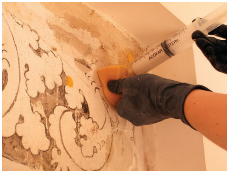
Lám. 40. Consolidación.