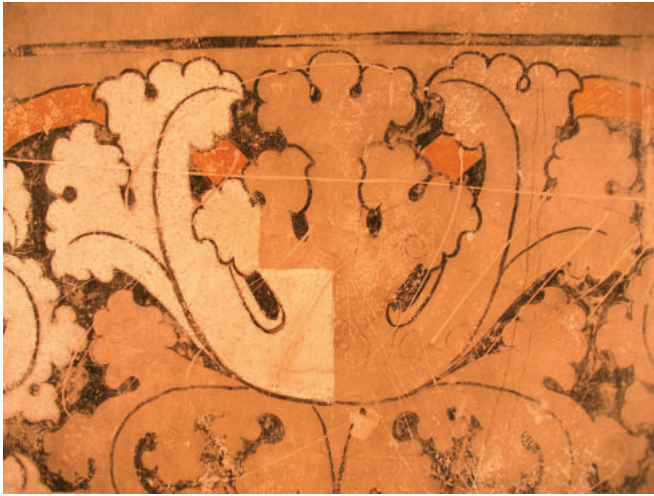
Lám. 37. Fase de limpieza.