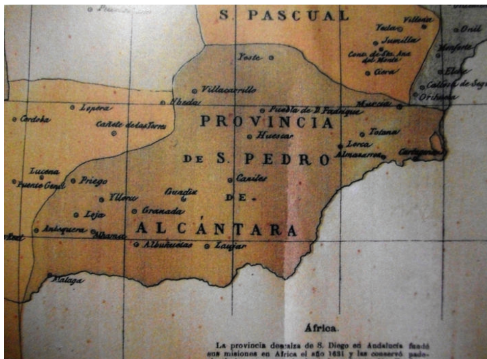
Lám. 1. Mapa de la provincia franciscana de San Pedro de Alcántara en el siglo XIX.

Toda Orden religiosa se asemeja a una compleja familia, propensa a albergar distintas corrientes de opinión, que van desde la ortodoxia a la interpretación más relajada de la Regla y por supuesto aquella tendencia a favor de una vida más austera y extrema en sus condiciones de dureza y ascetismo. La disparidad de criterios nos permite distinguir entre la laxitud en sus costumbres de los llamados “franciscanos conventuales” y el acentuado rigorismo promovido por san Pedro de Alcántara y sus seguidores.