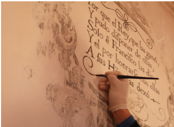
Lám. 42. Reintegración cromática.

El proceso concluyó con la reintegración cromática de los restos existentes y la reconstrucción de algunos fragmentos a partir de documentación gráfica ya conocida, así como información inédita descubierta recientemente. Esta tarea se realizó con pigmentos al silicato y con la técnica del bajo tono y la tinta plana, para diferenciar entre original y restaurado. Para encajar los fragmentos reconstruidos se emplearon plantillas en papel vegetal. Finalizó toda la obra con una ligera fijación.