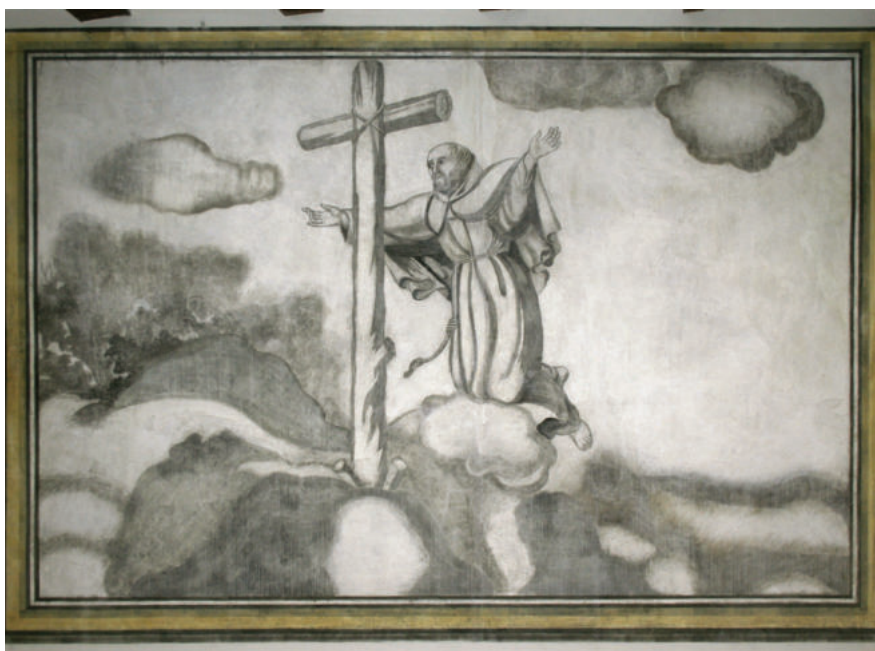
Lám. 5. San Pedro de Alcántara tras la restauración.