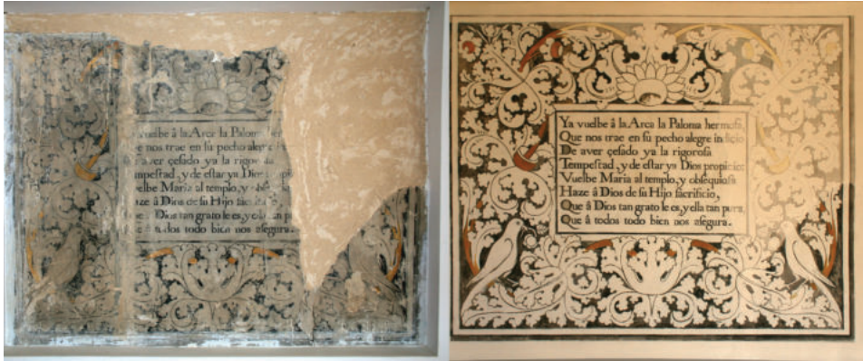
Láms. 43 y 44. Antes y después en la primera cartela de la galería oeste del claustro alto.