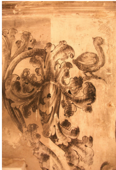
Lám. 38. Fase de limpieza.