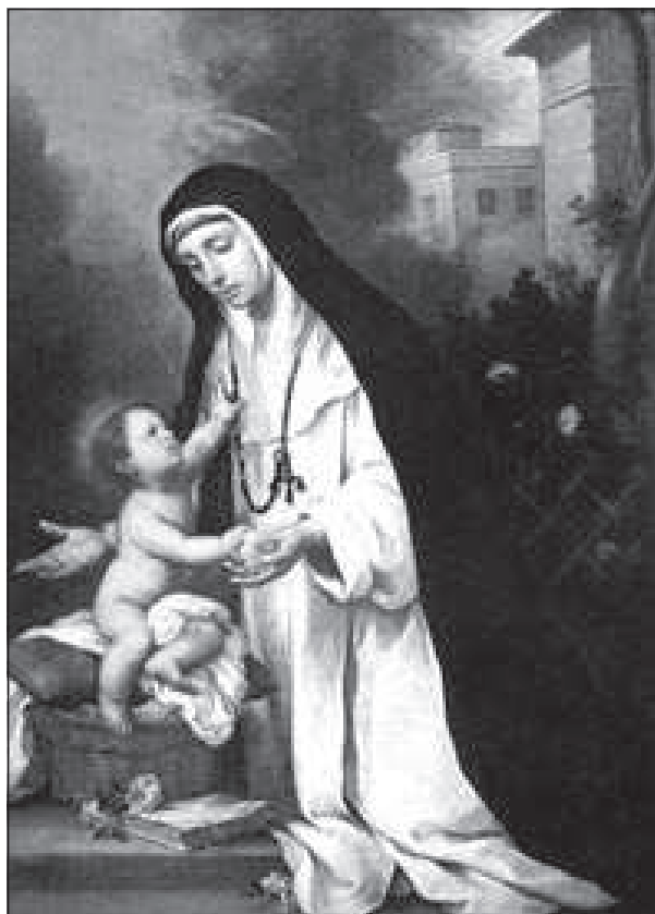
Bartolomé Esteban Murillo (taller). Santa Rosa de Lima. Kingston Lacy, Dorset.

o del convento de San Diego, el titulado San Francisco visitado por un ángel 25 . Estos cuadros, junto con el resto de piezas adquiridas en Granada, entre ellas el lienzo del Marqués, fueron a parar a la residencia familiar de Kingston Lacy en la localidad inglesa de Dorset, que desde el año 1981 se ha convertido en un museo dependiente de The National Trust. El lienzo de Santa Rosa está colocado en el llamado «Spanish Room», lugar donde también se exhibe como una de las joyas de la colección Las Meninas , durante mucho tiempo considerada como una versión de Martínez del Mazo, y hoy en día propia de Diego Velázquez 26 .