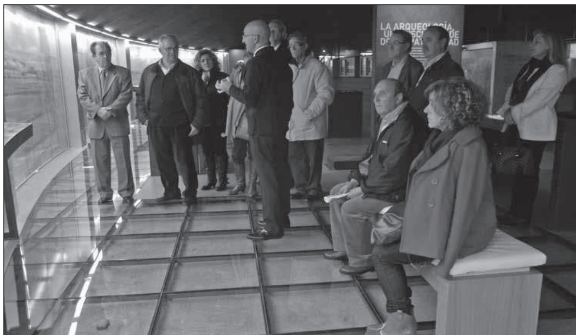
Grupo de asistentes durante la visita al CIYAB.

En junio de 2011 se firmó el convenio de colaboración con el Excmo. Ayuntamiento de Guadix para la edición del Boletín número 24, correspondiente al año 2011.