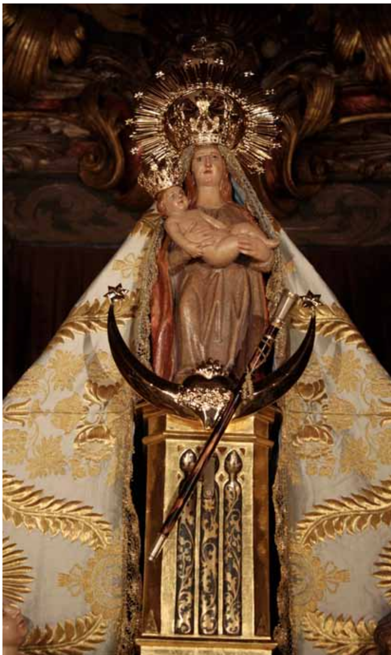
Imagen de Nuestra Señora de la Piedad (Baza).