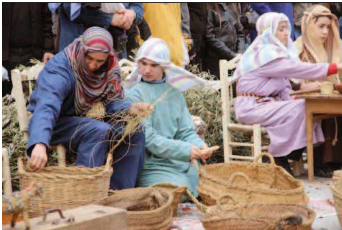
Fig. 9. Recuperación de oficios (Semana Santa viviente 2010).