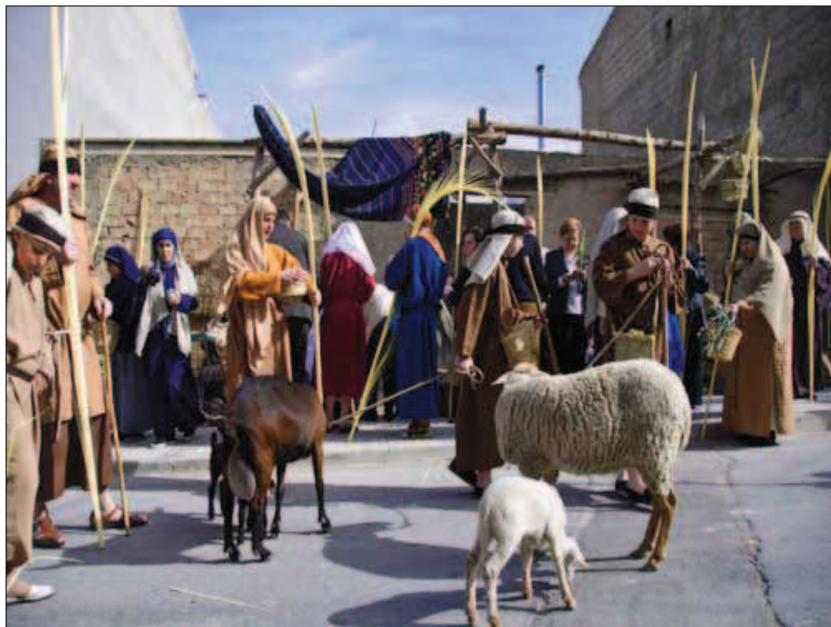
Fig. 3. Ambientación de la Jerusalén cueveña (Semana Santa viviente 2010).

Llama extraordinariamente la atención de nuestro entorno geográfico que esta Semana Santa viviente no se perderá nunca, porque en cada nueva edición seguimos recuperando dentro de sus actividades, aquellas costumbres y oficios de nuestros antepasados, que por desgracia se habían ido perdiendo en el olvido de los tiempos. Por esta razón, en estas anteriores ediciones hemos ido recuperado la trilla, la ganadería, la construcción de adobe, las espigadoras, la fragua, el horno de pan y el esparto, siempre situados en el recorrido del drama de Pasión (Domingo de Ramos, Jueves y Viernes Santo).