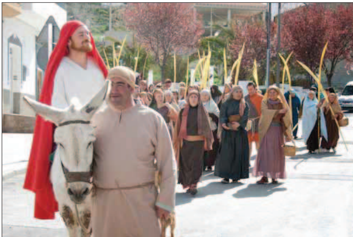
Fig. 2. Entrada triunfal a la Jerusalén cueveña (Semana Santa viviente 2010).

de nuestro pueblo, de nuestro entorno y de las entidades que los integraban, trabajando unidos todos: Ayuntamiento, Parroquia, entidades, grupos y el programa de la cofradía de Nuestra Señora de los Dolores. Y, en todo momento, con el beneplácito del Obispado de Guadix. Hace diecisiete años era impensable todo el gran “cosechón” que ya estamos recogiendo. Valga como ejemplo y admiración para todos –tanto propios como extraños– las 27 representaciones puestas en escena desde el año 2001; los más de 600 actores, actrices, figurantes, técnicos y colaboradores de nuestra localidad que participan anualmente; los más de 200.000 espectadores que ya han pasado por nuestro pueblo, considerando que la localidad de Cuevas del Campo solo cuenta, aproximadamente, con unos 2.300 habitantes.