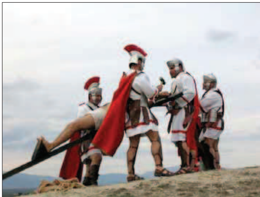
Fig. 7. Crucifixión (Semana Santa viviente 2005).