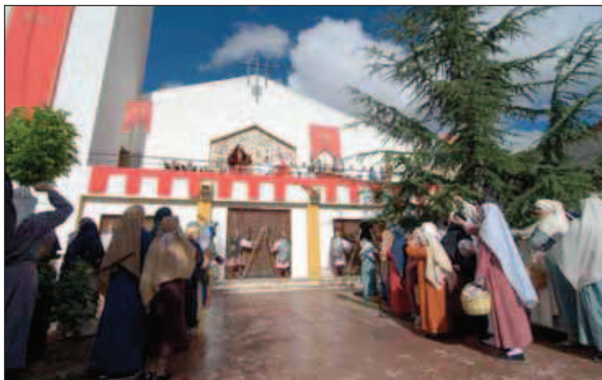
Fig. 4. El Pretorio recreado en la iglesia parroquial (Semana Santa viviente 2006).