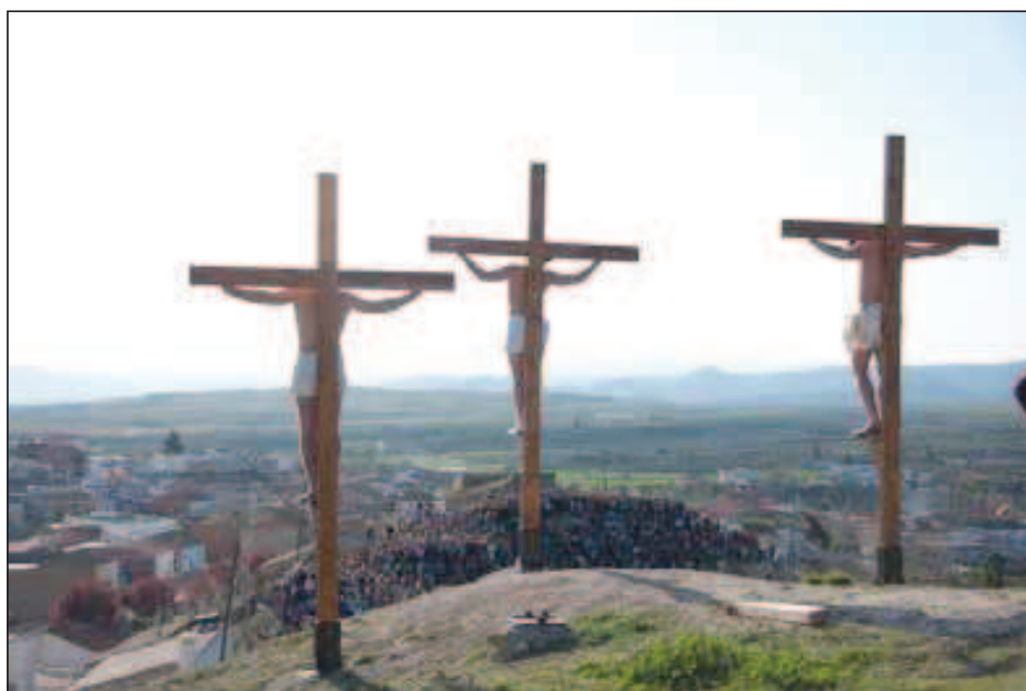
Fig. 1. Crucifixión cueveña (Semana Santa viviente 2010).

Fue en la Navidad de 1995 cuando se puso en marcha este apasionante y gran proyecto. Aunque la idea de su origen tuvo lugar en la década de 1960, siendo un adolescente de dieciséis años; después de ver en Almería la película El Evangelio según San Mateo del director italiano Pier Paolo Pasolini. Aquellas imágenes me impactaron profundamente al comprobar que la película podría haber sido filmada, perfectamente, en la localidad de Cuevas del Campo sin ningún tipo de problemas, debido al parecido de nuestros escenarios naturales, nuestras gentes y nuestra cultura popular. Aunque nuestro pueblo haya cambiado mucho en estos últimos años, como todos los demás. Allí nació, pienso yo, el embrión de esta Semana Santa viviente.