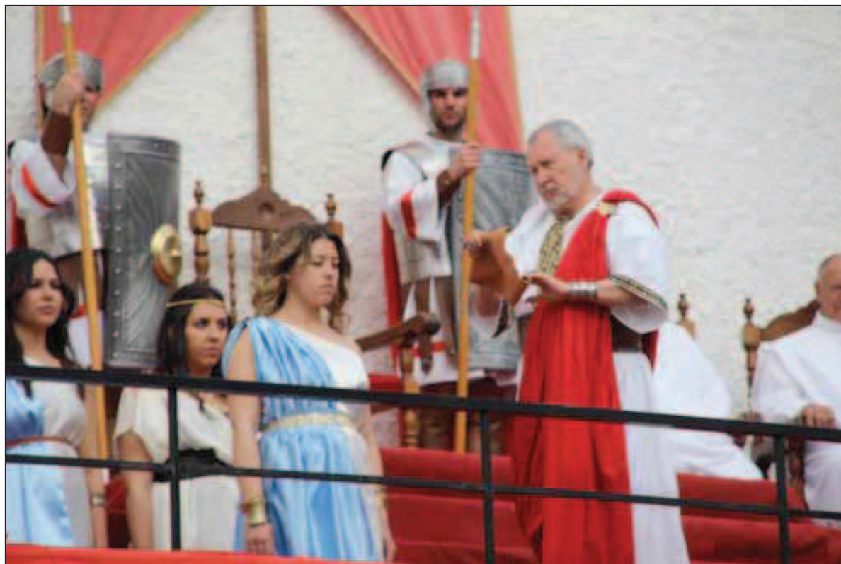
Fig. 5. Juicio de Pilato (Semana Santa viviente 2013).

cueveños, su oficio ancestral, donde los esparteros y sus hijos aparecen cargados en sus espaldas de este oro verde amarillento; las bestias con los aperos de antes y los pastores con el ganado, pasando frente al palacio del gobernador de Judea con todo su estruendo, defecaciones en ruta y balidos; en días de frío intenso se refugiarán muy cerca de nuestra ciudad.