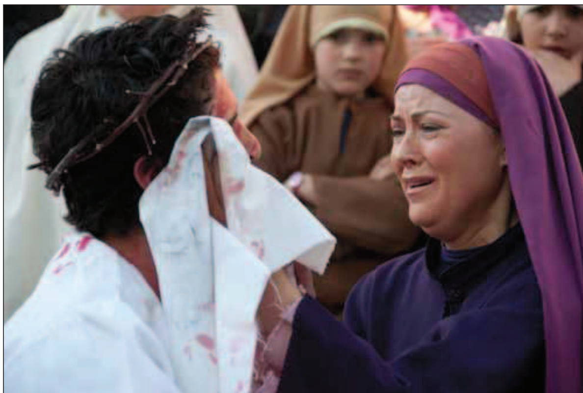
Fig. 6. La Verónica (Semana Santa viviente 2010).

Más de un visitante, pues nunca antes en esta Jerusalén cueveña se había visto tanta gente concentrada, se sintió transportado al interior de este drama de Pasión para ver morir al Nazareno en el Gólgota de Cuevas del Campo, junto a dos malhechores. Sin duda, no podrán olvidar tampoco dónde estaban cuando oyeron golpear los látigos, una y otra vez, sobre la espalda de Jesús.