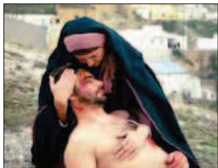
Fig. 10. Piedad (Semana Santa viviente 2010).

plenamente y sin descanso a este gran proyecto, ya totalmente realizado y bordado con letras de oro en los anales de nuestra historia y en el del altiplano de Granada, porque hemos sido pioneros en esta actividad tan importante y complicada, con sumo esfuerzo e ilusión inimaginables.