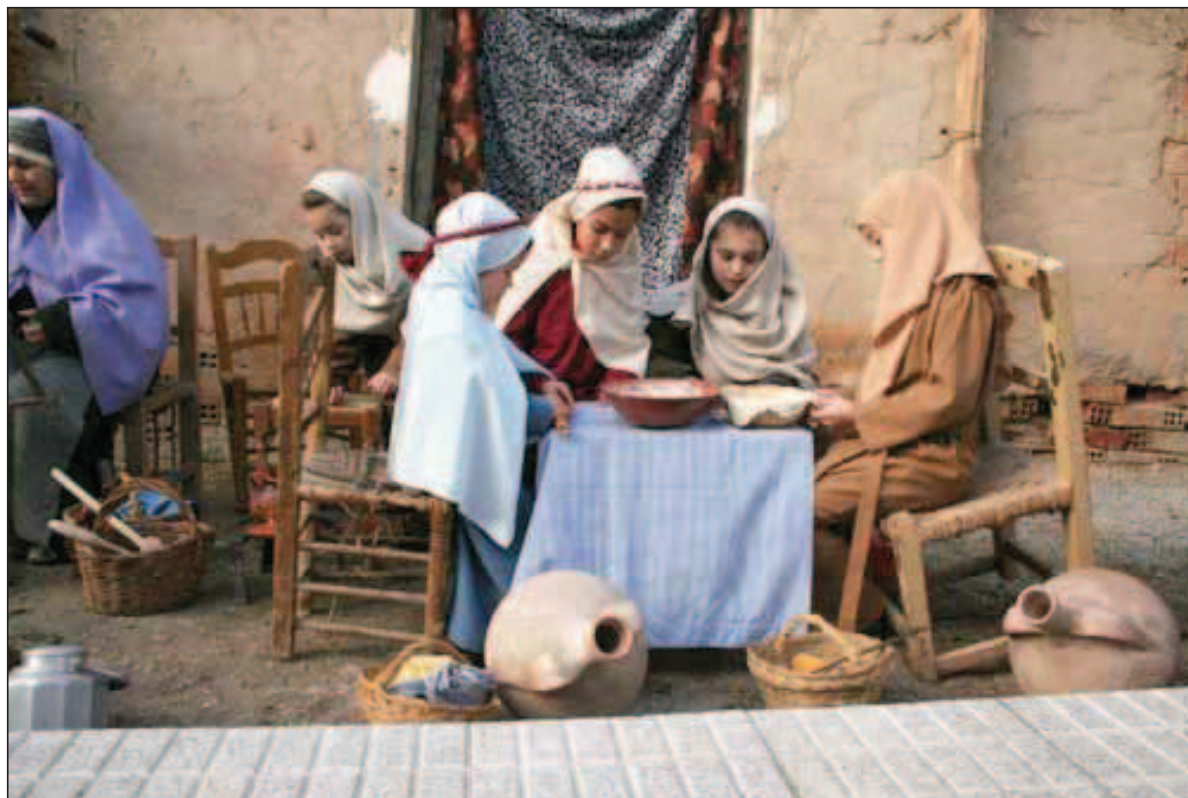
Fig. 8. Recuperación de oficios (Semana Santa viviente 2010).