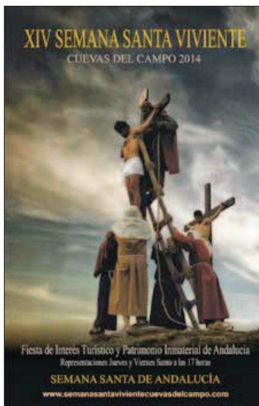
Fig. 12. Cartel de la XIV Semana Santa viviente (2014).