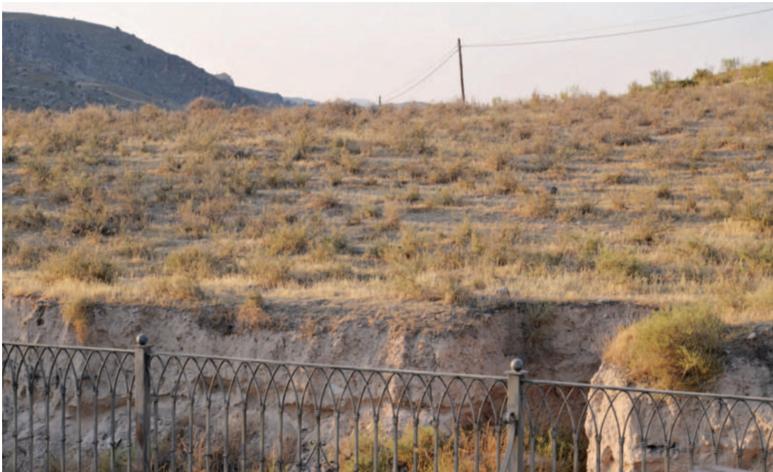
Lám. 6. Balneario de Alicún de las Torres (2014). Vista general del llano de la Ermita desde la trasera del terraplén de la ermita actual.

“En este yacimiento también se han podido documentar los restos arqueológicos procedentes de una villa romana, tanto estructuras, algunos muros y pavimentos, como material constructivo disperso en superficie (tégulas e ímbrices) y fragmentos cerámicos, donde destaca la cerámica de almacenamiento, fundamentalmente dolia.” 39