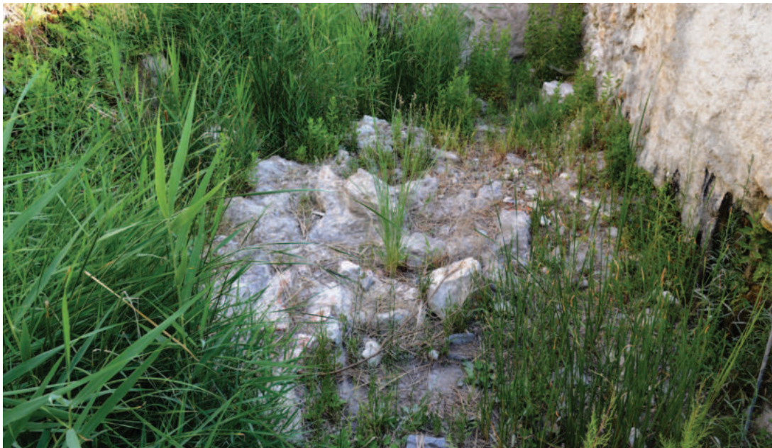
Lám. 5. Balneario de Alicún de las Torres (2014). Zona trasera del balneario actual, vista del detalle del suelo de la antigua piscina de pobres.