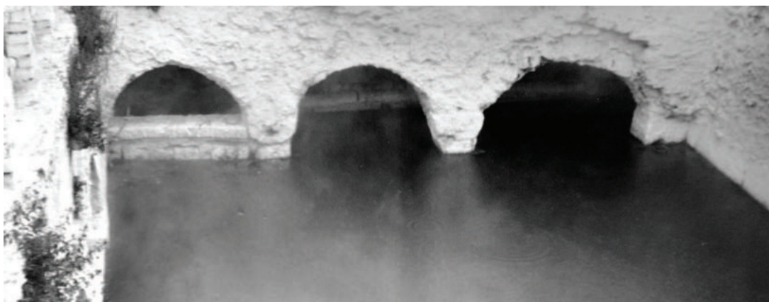
Lám. 1. Balneario de Zújar (1984). Zona suroeste de la piscina, con tres arcos sobre pilares (el de la izquierda, parcialmente tapiado).

Frente a la descripción de Sierra, sucinta en este punto, en este caso se incide en el aspecto de lo que denomina claustro, de forma cuadrada y con tres arcos por lado, enmarcando la piscina. Hasta su destrucción en 1985 quedaban en pie los tres arcos de uno de los lados (lám. 1; fig. 1, n.º 9).