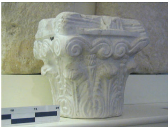
Lám. 7. Capitel romano. Museo Arqueológico y Etnológico de Granada.