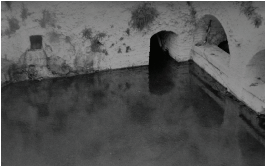
Lám. 3. Balneario de Zújar (1984). Zona noreste de la piscina.

que quien describía de modo más certero era Ayuda (al citar un “claustro” de tres arcos por una parte y cuatro por la otra). En el tercer lado, el siguiente al de los cuatro arcos (lám. 3), todo el muro está tapiado a excepción, por una parte de una pequeña entrada a la derecha, que es donde desemboca otra habitación (fig. 1, n.º 5), de factura más moderna incluso en el graderío de bajada a la piscina (que presenta una escalera con cinco peldaños en vez de las tres gradas de las otras habitaciones) y, por otra, de un pequeño hueco cuadrado en el centro de la pared y a media altura que comunica directamente con el manantial (fig. 1, n.º 6). Finalmente el cuarto lado de la piscina es una pared continua.