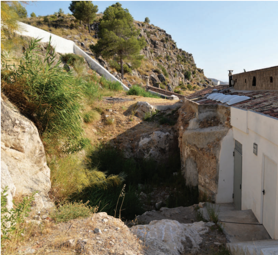
Lám. 4. Balneario de Alicún de las Torres (2014). Zona trasera del balneario actual, vista general.

El argumento que plantea, lógico e intuitivo sin duda, es que los pobladores de la zona, desde una época remota que denomina antediluviana, no pudieron dejar de usar aguas con unas características y una termalidad tan evidente, incluidos también los romanos.