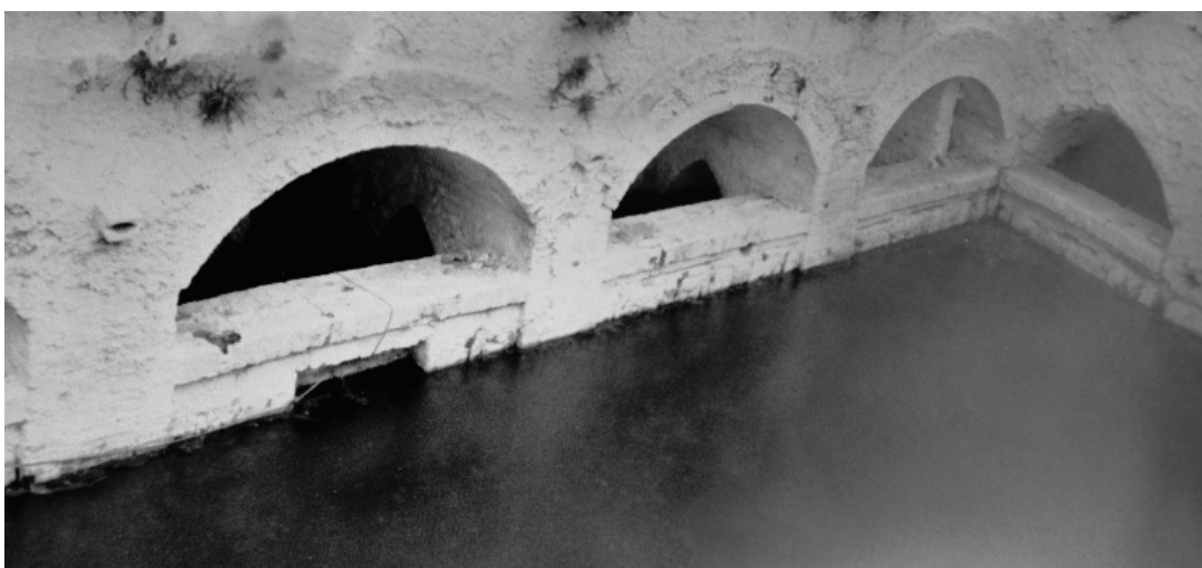
Lám. 2. Balneario de Zújar (1984). Zona sur de la piscina, con cuatro arcos soportados sobre pilares.

También se respetó en el lado contiguo izquierdo una estructura que presenta particularidades respecto del resto del conjunto (lám. 1). La forman tres arcos soportados en dos pilastras. El arco de más a la izquierda está parcialmente tapiado, mientras que los otros dos se sostienen en una pilastra más fina y descansando directamente en el propio suelo de la piscina (fig. 1, n.º 9). Por su parte la pilastra de la derecha parece reforzada con el añadido de la tapia que cierra esta parte.