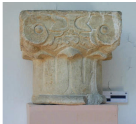
Lám.8. Capitel nazari. Museo Arqueológico y Etnológico de Granada.