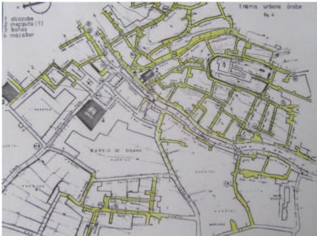
Fig. 1. Plano de Huéneja. Sombreado el posible trazado de waniya y los harat de Once Casas (primer plano) y Alto Lugar (derecha), sobre plano escala 1:2000.

El baño se localiza a la salida del casco urbano, en el paraje hoy denominado El Bañuelo, al final de la calle del Agua, números 42 y 44 y esquina con la de Carvajal Herrera, números 1 y 3 que se dirige hacia el campo en el antiguo camino de Guadix. Hasta nuestros días ha pasado desapercibido por hallarse envuelto en construcciones de la segunda mitad del siglo XVII destinadas a viviendas, pajar, leñera y aperos agrícolas. Conocemos su existencia por dos clases de fuentes, unas indirectas como pueden ser las tipológicas y toponímicas y directas las otras, como las documentales y arqueológicas.