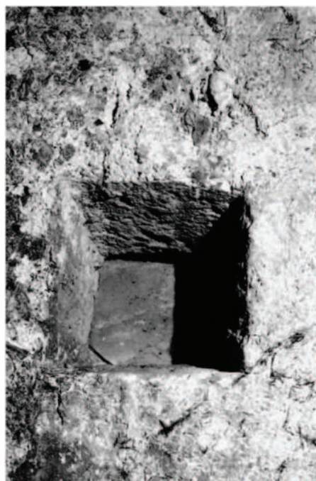
Lám. 5. Detalle de lucerna o lumbra del baño de Huéneja (1981).

A continuación el usuario del baño pasaría a la tercera sala, la central, el wastani – al-bayt al-wastani – o sala templada, de similares dimensiones a la anterior, pero de mayor anchura, en veinte centímetros. En su centro, sendos accesos en ambos muros de 0,80 m de luz, que le servían de comunicación con las salas segunda y cuarta. Se encuentra en perfecto estado, aunque en 1981 servía como pajar, por lo que no se pudo realizar un estudio más a fondo de la misma. Dispone, como en dichas salas de cuatro lucernas cuadradas a eje de la bóveda, de 0,45 x 0,45 x 0,45 m. Ésta es de medio cañón y está recubierta, como las contiguas, de mortero de cal sujetando lajas de piedra adovelada, lo que le otorga una gran consistencia.