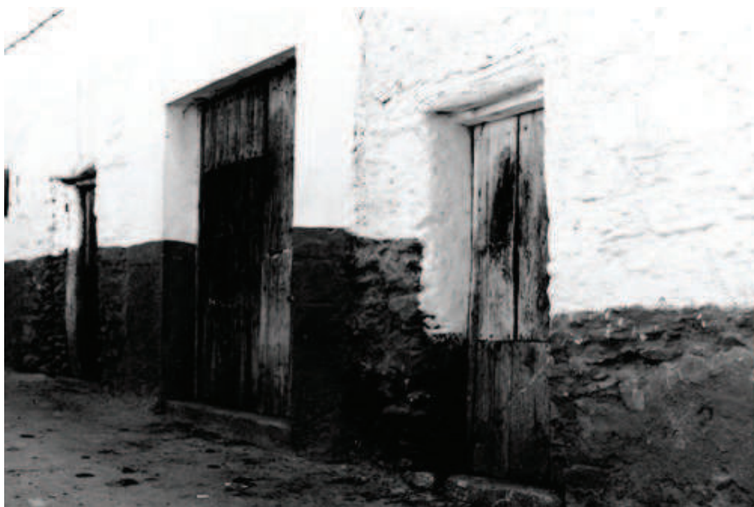
Lám. 2. Puertas que se corresponden con cada una de las salas del baño (1979).