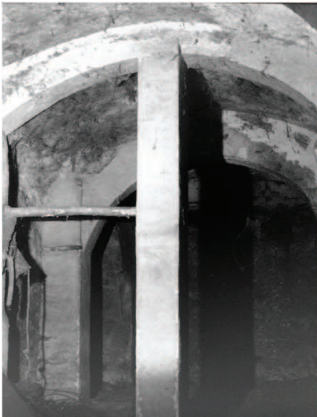
Lám. 3. Sala I o del al-bayt al-maslaj (1980). Véase la defectuosa restauración del arco perpiaño central.