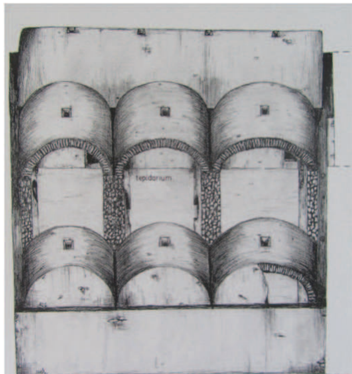
Fig. 3. Reconstrucción hipotética del alzado del baño de Huéneja (según Miguel A. Rivas).