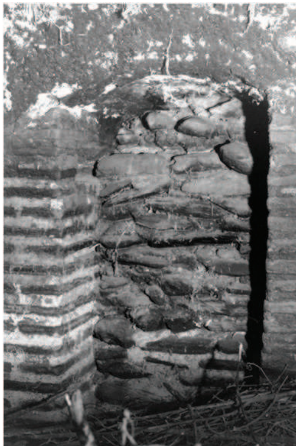
Lám. 6. Sala IV (al-bayt al-sajun) o caliente. Detalle de uno de los probables accesos al caldarium con revestimiento posterior de ladrillo macizo en las jambas (1981).

Esta sala mide, como las dos anteriores, 8 m de longitud; pero su anchura es mayor que aquéllas al medir 2,90 m de muro a muro. En esta sala sí se observan varios elementos que no están presentes en las anteriores y que me inclinan, por ahora, a pensar que debió tratarse de la sala cálida: