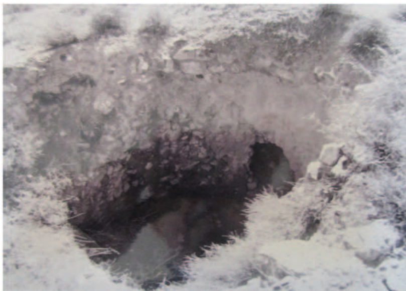
Lám. 8. La Calera de las Cuevas, de donde podría proceder la cal utilizada en el baño árabe de Huéneja por ser el más próximo al mismo (1981).