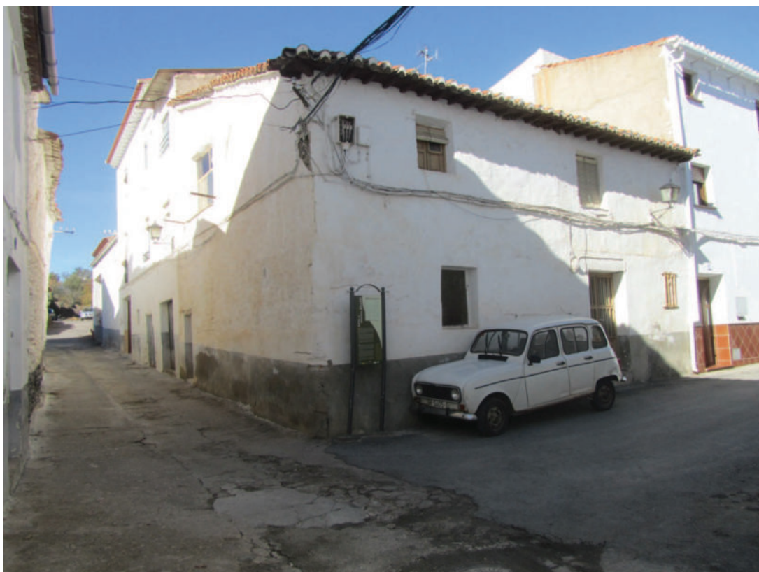
Lám. 1. Aspecto externo de las viviendas habilitadas sobre el antiguo baño de Huéneja (2014).

“Hiçose otra suerte de viñas en la solana entre la valsa del camino de Guadix que solia ser de Alonso Hernández de Alvaladejo es çerca de la açequia y de un guerto de encima de los vaños que solia ser de Buendia el sacristán y la mitad de la viña del Almendral que solia ser de Almarça que parte Pedro Alvaro. La viña alinda con trançe primero de Juan Rodriguez y con alcazel de Cuerva y el guerto alinda con los vaños y camino de Guadix y vancal de çiento de Bernardino Bazquez.” 11