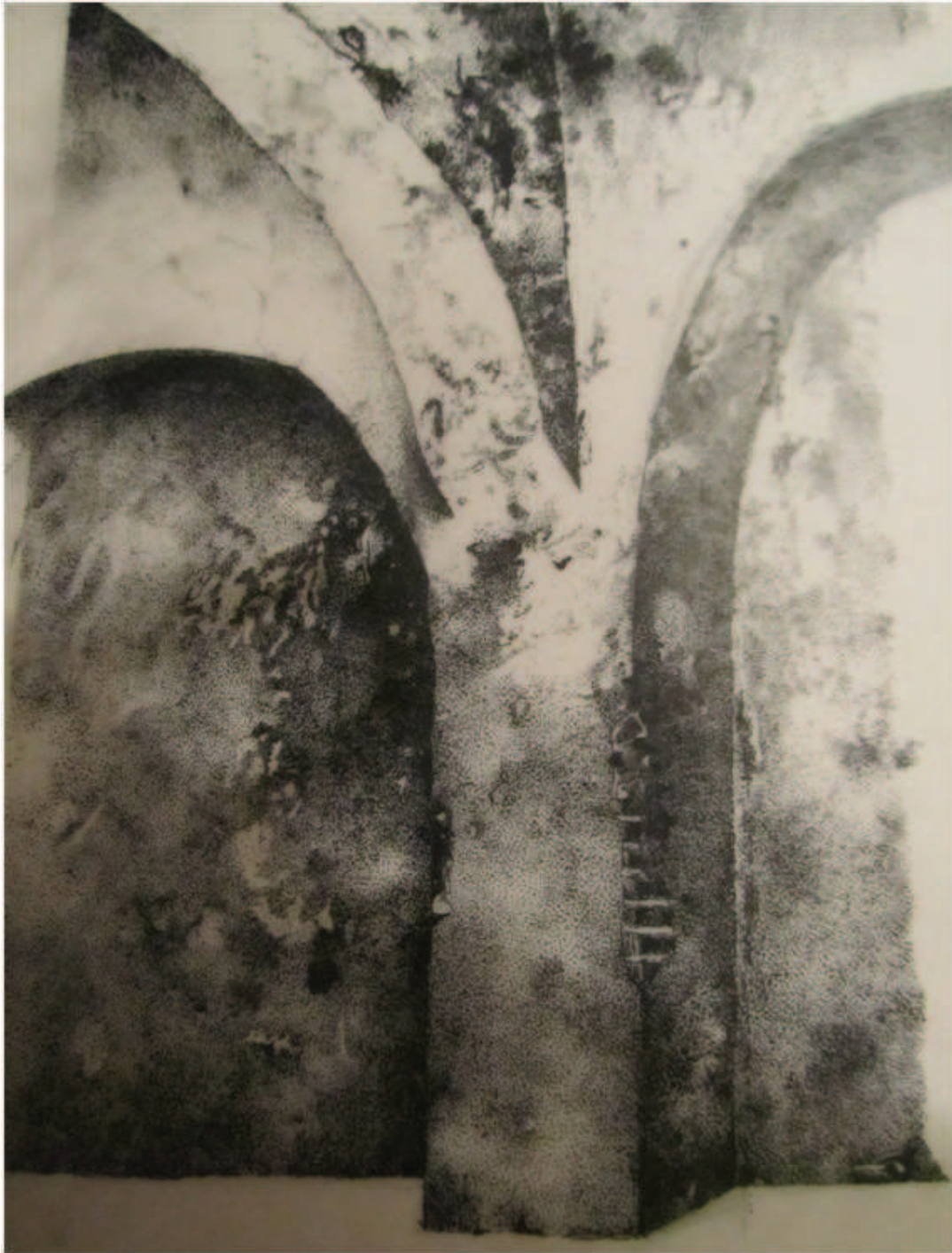
Fig. 4. Sala I (al-bayt al-maslaj). Detalle de pilar adosado al muro de levante con los arranques de los arcos en 1981 (según Miguel A. Rivas).