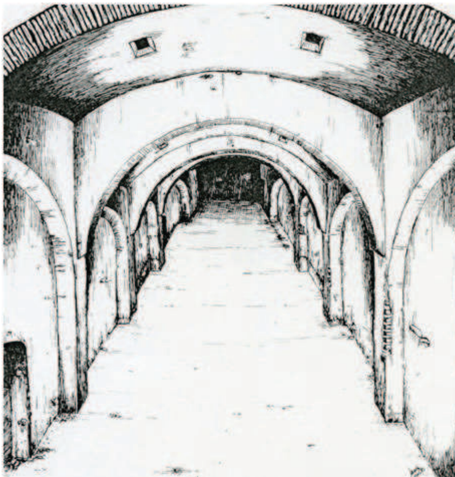
Fig. 5. Sala I (al-bay al-maslaj). Reconstrucción hipotética de su estado original (según Miguel A. Rivas).

segunda sala. Su bóveda es de medio punto rebajado y sobre ella se disponen ocho lucernas pareadas, que irían acristaladas con el fin de iluminar cenitalmente el interior durante el día, a la vez que permitirían al bañero graduar el vapor de agua del interior en el caso de las naves tercera y cuarta; o iluminarlas artificialmente, mediante hachas, en el caso de recibir el baño al anochecer. No debemos olvidar tampoco que esta actividad era ejercitada tanto por hombres como por mujeres regulándose su uso a diferentes horas y días de la semana.