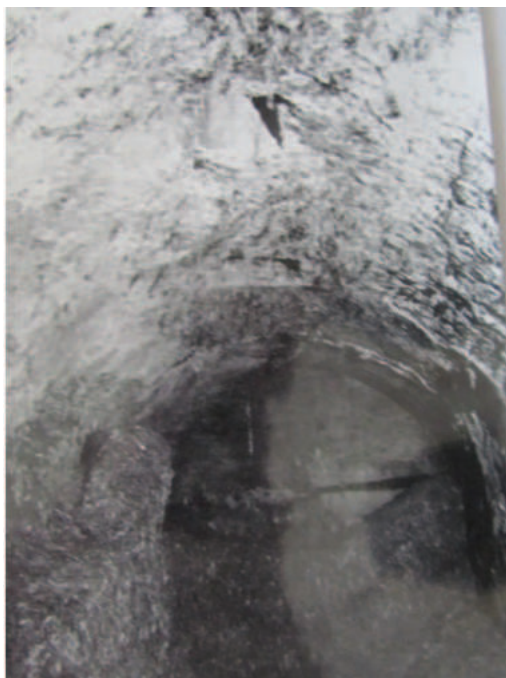
Lám. 4. Sala II (al-barid) o fría (1981).

cuarta, que se observa tapiado desde antiguo. Esto pone de manifiesto una salida a la calle o un acceso desde ella que nos hace pensar en alguna reforma del baño a lo largo de su historia, que alteraría incluso el sentido del uso y por tanto del itinerario, o bien dispondría de una doble entrada. La longitud de esta primera sala del baño es de 8 m y 2,40 m de anchura, por 2,75 m su altura hasta la clave de la bóveda; menor, sin duda, de la que debió tener en origen debido a la altura de los materiales de relleno, cuya potencia de estrato debe ser, como ya he comentado, bajo el que se encontraría el pavimento. Éste consistiría en losetas de barro cocido, acaso dispuestos en forma de espina de pez como en el baño de Torres Torres, en Valencia, estudiado por Torres Balbás, o el palacio de Muhammad V en el posterior convento de San Francisco en la Alhambra, en su última etapa, estudiado por el autor en 1981, donde alterna la solería de barro cocido y la de mármol.