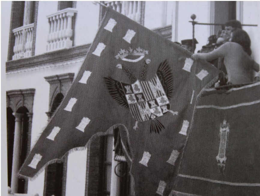
Lám. 1. Tremolación del pendón de Baza desde el balcón del Ayuntamiento Viejo el 3 de diciembre.

Acto a continuación se tremola el pendón y se toca el himno nacional de España. Todo lo anterior se hace tres veces, bajo fuertes ovaciones de los asistentes, y una vez se termina hay un fuerte estruendo de cohetes.