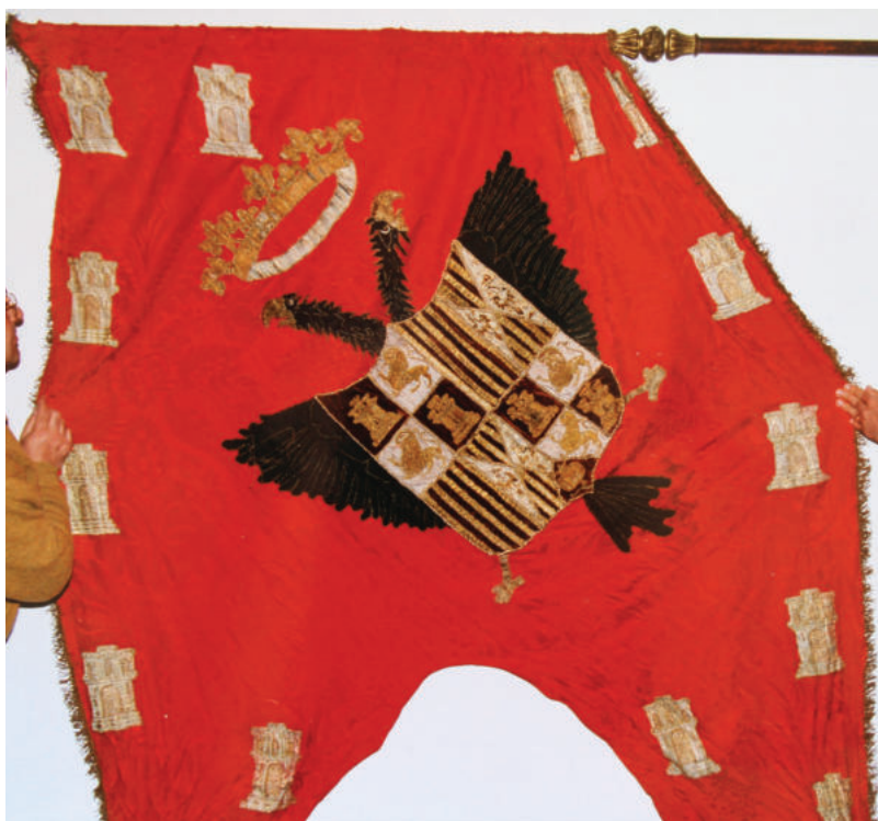
Lám. 2. Pendón Real del Ayuntamiento de Baza.

Como muy bien podemos observar, se trata de un estandarte de forma rectangular acabado en dos farpas redondeadas en su final, realizado en una única pieza de seda adamascada carmesí, que mide 2,25 m de largo por 1,65 m de ancho aproximadamente, con flecos de oro (lám 2). El asta de madera del pendón mide 2,82 m aproximadamente, rematada por una pequeña alabarda metálica de 20 cm de larga. En anverso y reverso del pendón, en su centro el escudo de los Reyes Católicos, cuartelado a la manera castellana. Es decir, primero y cuarto, cuartelado de Castilla y León, las armas de la reina Isabel I; segundo y tercero, partido de Aragón y Aragón-Sicilia, correspondientes y los títulos de primogénito de Aragón y rey de Sicilia que tenía el rey Fernando; en punta, la granada.