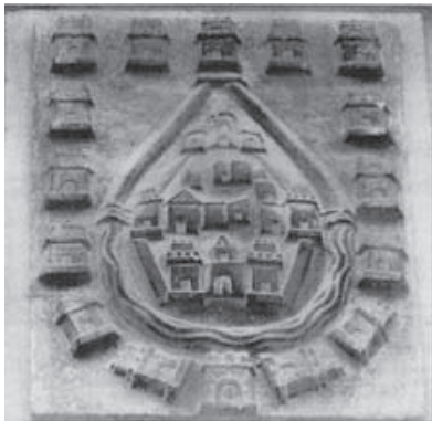
Lám. 6. Escudo de Baza (1592). Ayuntamiento viejo, Baza.

“Le damos por armas la forma de diez y seis castillos con su albarrada que se hicieron por nuestro mandado al tiempo que Nos teníamos cercada la dicha ciudad, en campo colorado.”