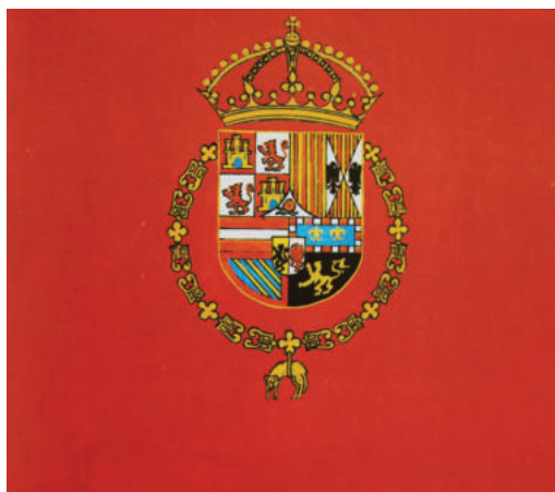
Lám. 5. Bandera Real de España. Reinado de Felipe II (1556-1598)