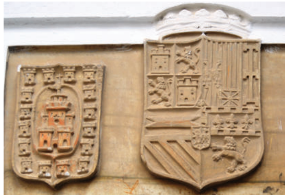
Lám. 7. Escudos de Baza y de Felipe II (1568). Carnicerías Reales, Baza.

Se trata de un diseño original que recrea la descripción topográfica del cerco de Baza en 1489, sitio que culminó con la toma de la ciudad el día 4 de diciembre del mismo año, festividad de Santa Bárbara.