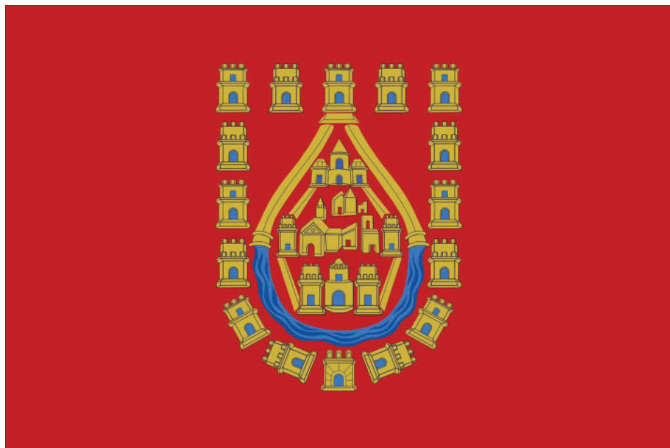
Lám. 8. Nueva bandera municipal de Baza (2017).