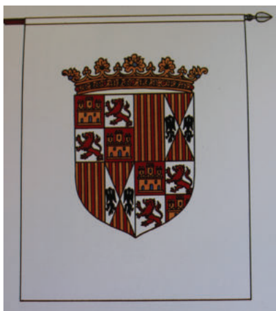
Lám. 4. Pendón Real de los Reyes Católicos 1492.

De la detenida lectura de lo anterior, Magaña Visbal se equivoca. En primer lugar, el escudo regio que hay en el estandarte real de Baza es un escudo de los Reyes Católicos, y no un escudo con las armas de Felipe II, no hay nada más que comprobarlo (láms. 4 y 5). Por otra parte y como bien dice, "en una de las sesiones se encarga a dos Regidores vayan a la ciudad Granada y traten de la confección de un estandarte carmesí con las armas de Felipe II y las de Baza"